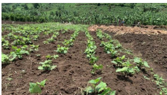
Levée après semis en ligne dans un champ d'un bénéficiaire