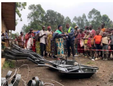
Point de contrôle de conformité avant la réception de l'assistance