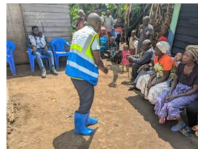
Ces images sont l'illustration des activités de sensibilisation communautaire à Kalengera et à Rumangabo

Activité 3 : Formation des enquêteurs et mise en place des comités de ciblage au sein de la communauté : pour la mise en œuvre effective de l'activité de ciblage, la FAO avait procédé tout d'abord par la formation des enquêteurs sur l'outil de collecte des données permettant de réunir toutes les informations nécessaires sur les ménages remplissant les critères.