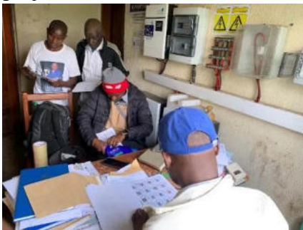
Présentation des listes provisoires des bénéficiaires au chef de groupement

Activité 5: Facilitation de la validation de listes de bénéficiaires sélectionnés par l'affichage de celles-ci, la collecte et traitement de plaintes : Une fois que les données collectées en termes de ciblage ont été partagées à l'équipe technique de la FAO, s'en est suivi une phase de présentation des résultats aux différentes parties prenantes au niveau local pour information et orientation sur les emplacements appropriés pour l'affichage. Ce qui nous a permis d'afficher les listes des bénéficiaires dans 11 villages et sous-villages touchés par le projet.