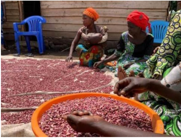
Photo des membres d'un ménage bénéficiaire du projet, entrain de trier le haricot avant de les acheminer au marché local