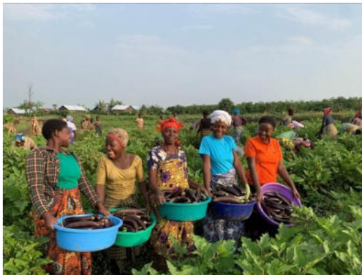
Photo de famille des membres d'un groupe solidaire après la récolte d'aubergine dans leur champ communautaire à kalengera