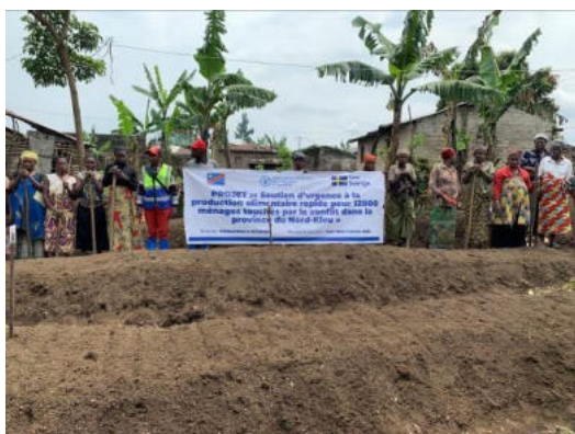
Photo de famille après installation des premiers germes à Kako