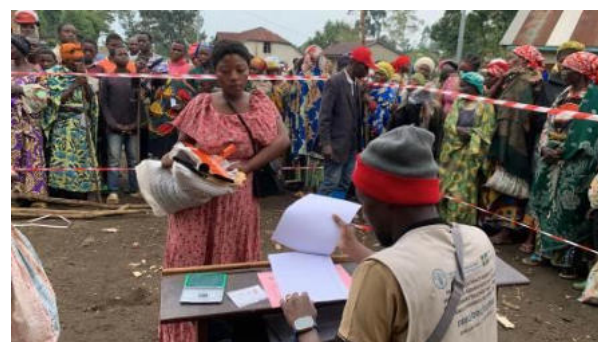
Point d'émargement manuel après avoir reçu l'assistance