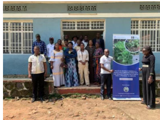
Ces images sont l'illustration de l'assemblée communautaire organisée à Rutshuru

Quatre questions majeures étaient développées dans cette assemblée :