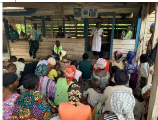
Sensibilisation communautaire sur l'importance d'une alimentation équilibrée