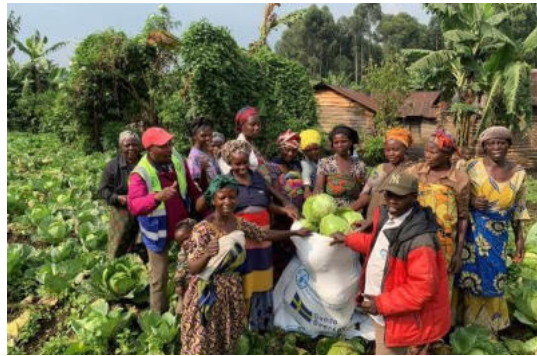
Photo de famille des membres d'un groupe solidaire après la récolte des choux dans leur champ communautaire