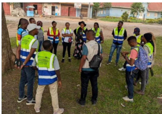
Briefing des enquêteurs par le coordonnateur du projet de la DPF, avant la descente sur terrain

Activité 4 : Enquête de collecte et enregistrement de données (qualitative et quantités) de ménages identifiés, répondant aux critères de vulnérabilité, en étroite collaboration avec les cellules d'animation communautaire : Après la formation, une équipe d'enquêteur avait été déployée sur terrain pendant une durée de 6 jours, laquelle qui a parcouru toute l'étendue de la zone ciblée en enregistrant les ménages remplissant les critères de sélection avec l'appui du comité de ciblage. Au total 8629 ménages avaient été enregistrés, parmi lesquels 8000 seront retenus.