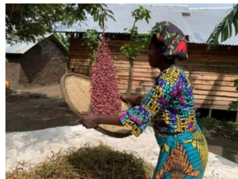
Photo d'un bénéficiaire du projet en pleine activité poste récolte de haricot.