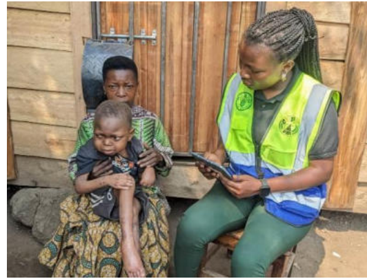
Echange avec une cheffe de ménage, pendant l'activité de collecte des données base line du projet

Activité 5: Facilitation de la validation de listes de bénéficiaires sélectionnés par l'affichage de celles-ci, la collecte et traitement de plaintes : Une fois que les données collectées en termes de ciblage ont été partagées à l'équipe technique de la FAO, s'en est suivi une phase de présentation des résultats aux différentes parties prenantes au niveau local pour information et orientation sur les emplacements appropriés pour l'affichage. Ce qui nous a permis d'afficher les listes des bénéficiaires dans 11 villages et sous-villages touchés par le projet.