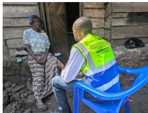
Echange avec une cheffe de ménage, pendant l'activité d'enregistrement des potentiels bénéficiaires