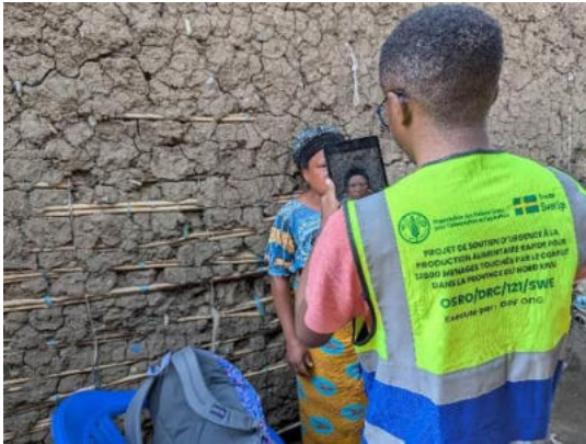
Prise d'une photo d'une cheffe de ménage, pendant l'activité d'enregistrement des potentiels bénéficiaires