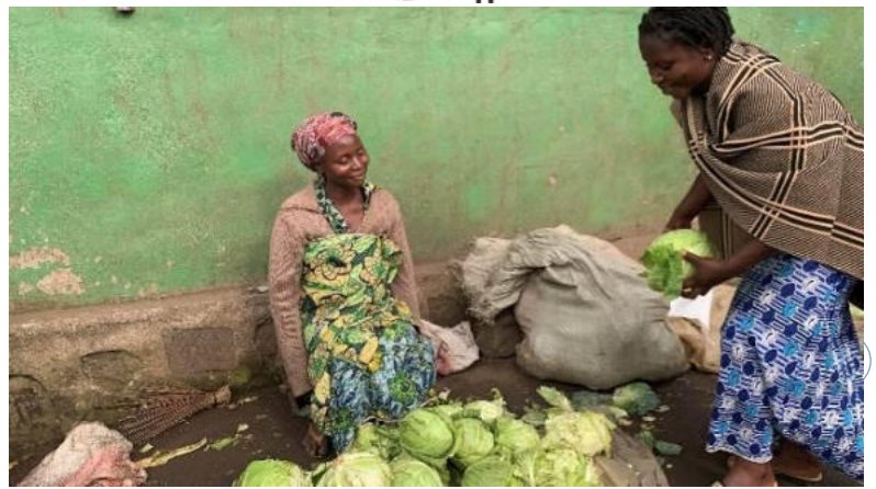
Photo d'une bénéficiaire du projet, en pleine vente des choux sur une ruelle à quelque metre de son ménage