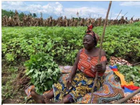
Une bénéficiaire du projet après avoir récolté une petite quantité d'amarante dans son champ