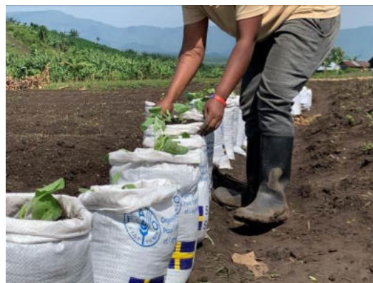
Installation des substrats en sacs