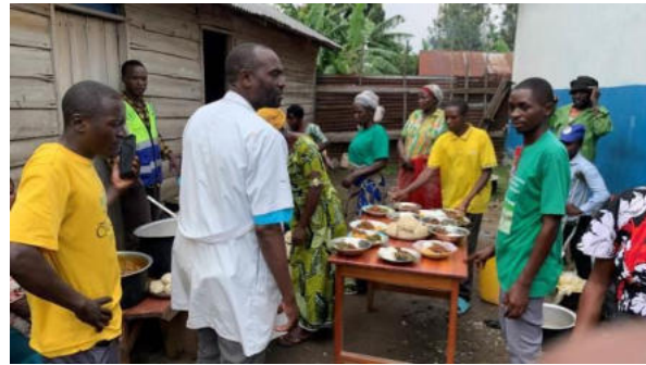
Organisation d'une session de démonstration culinaire à Rubare, avec les produits récoltés dans le champ communautaire