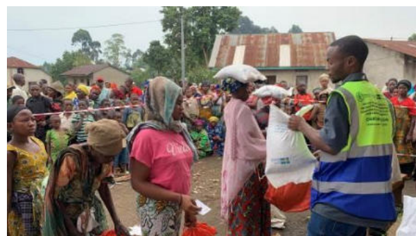
Réception de l'assistance par les bénéficiaires