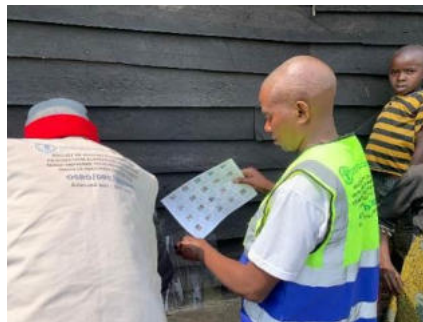
Affichage des listes des bénéficiaires à Kabaya et sensibilisation communautaire sur les mécanismes de gestion des plaintes